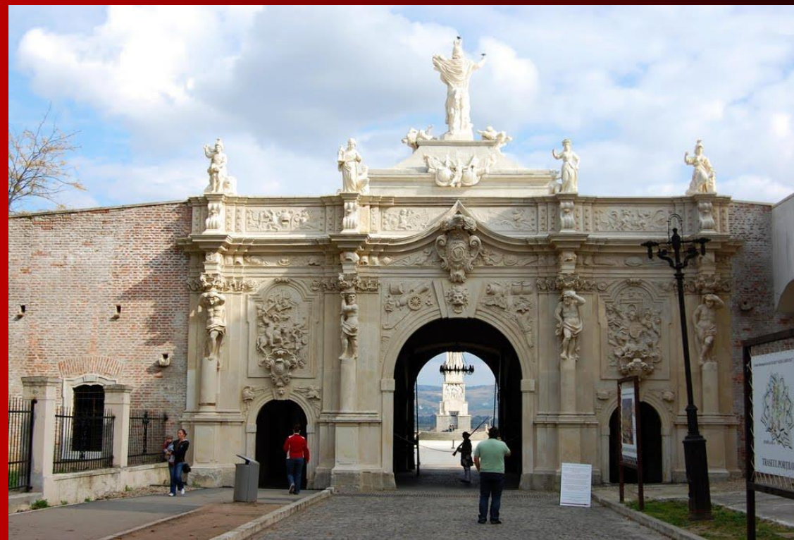
GYULAFEHÉRVÁRI FELSŐ KAPU