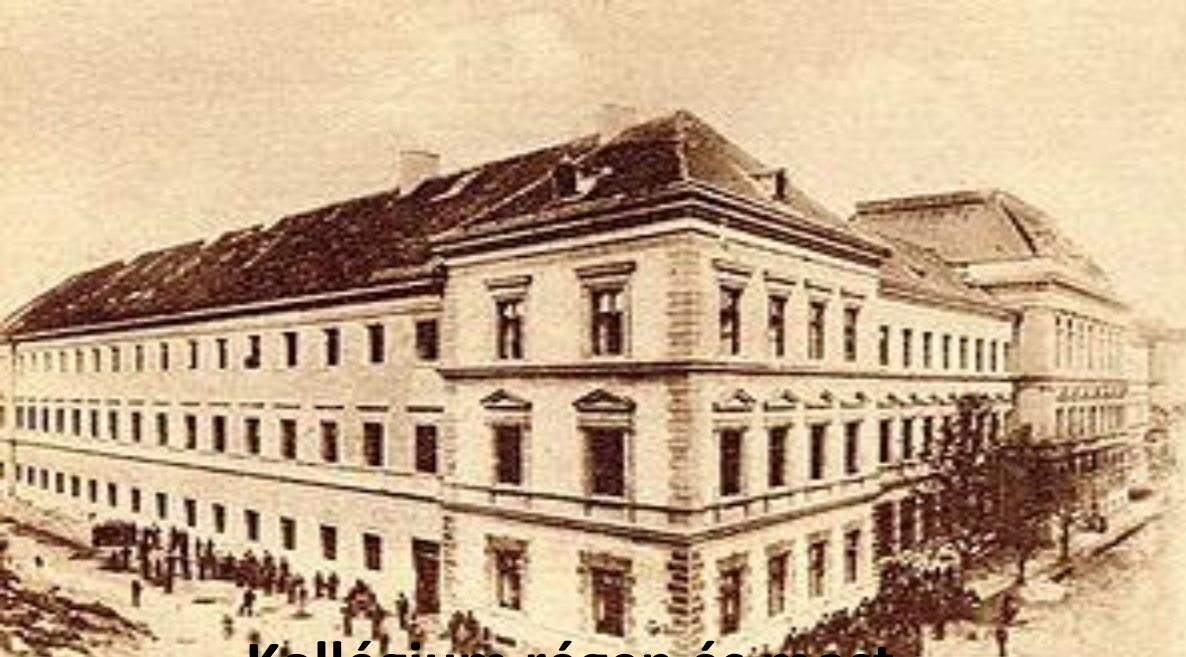
Kollégium régen és most