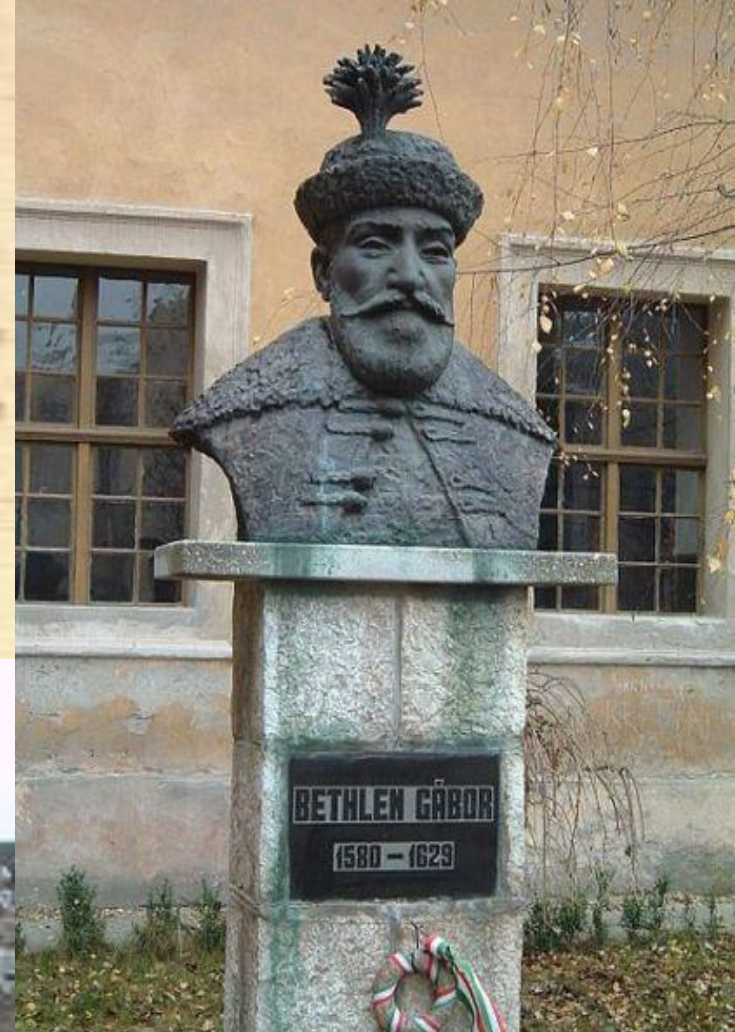
A Kollégium alapítójának szobra az intézmény udvarán