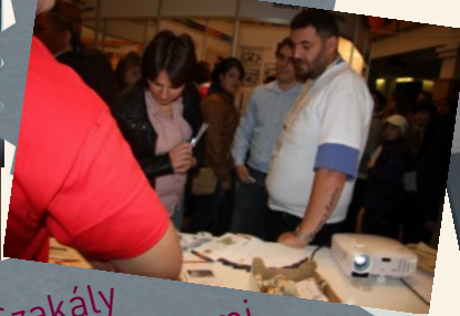
Szakály történelmi emlékverseny