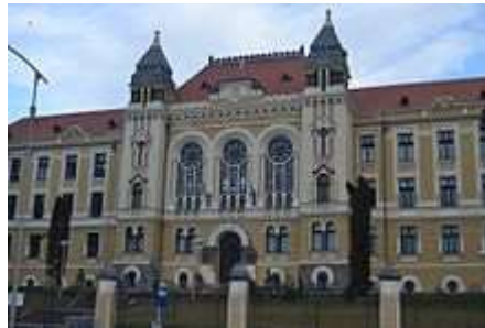
Márton Áron Gimnázium

A Márton Áron Gimnázium Csíkszereda legimpozánsabb épülete, a Szék útja és a hajdani Rákóczi utca (ma Márton Áron utca) találkozásának közelében található, szecessziós stílusban épült 1909 és 1911 között.