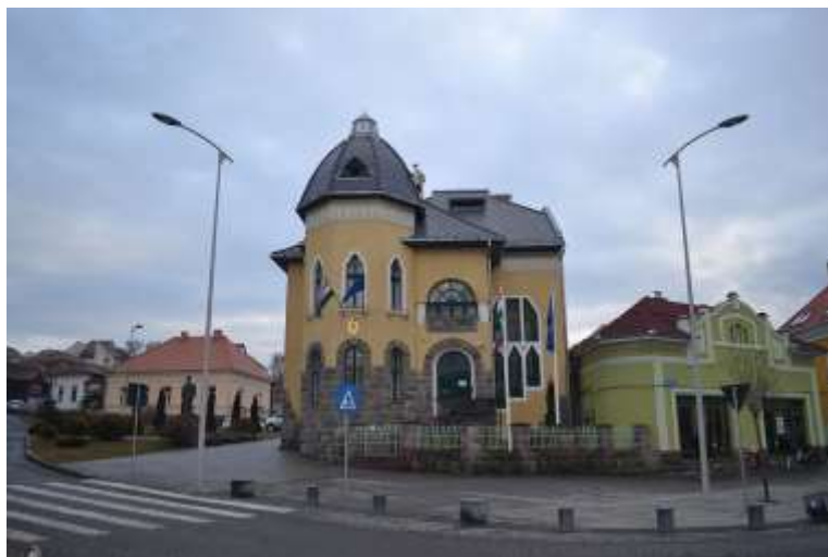
A magyar konzulátus épülete

A csíksomlyói kegytemplom és kolostor a magyarság egyik legnagyobb zarándokhelye és kultúrtörténeti emléke.