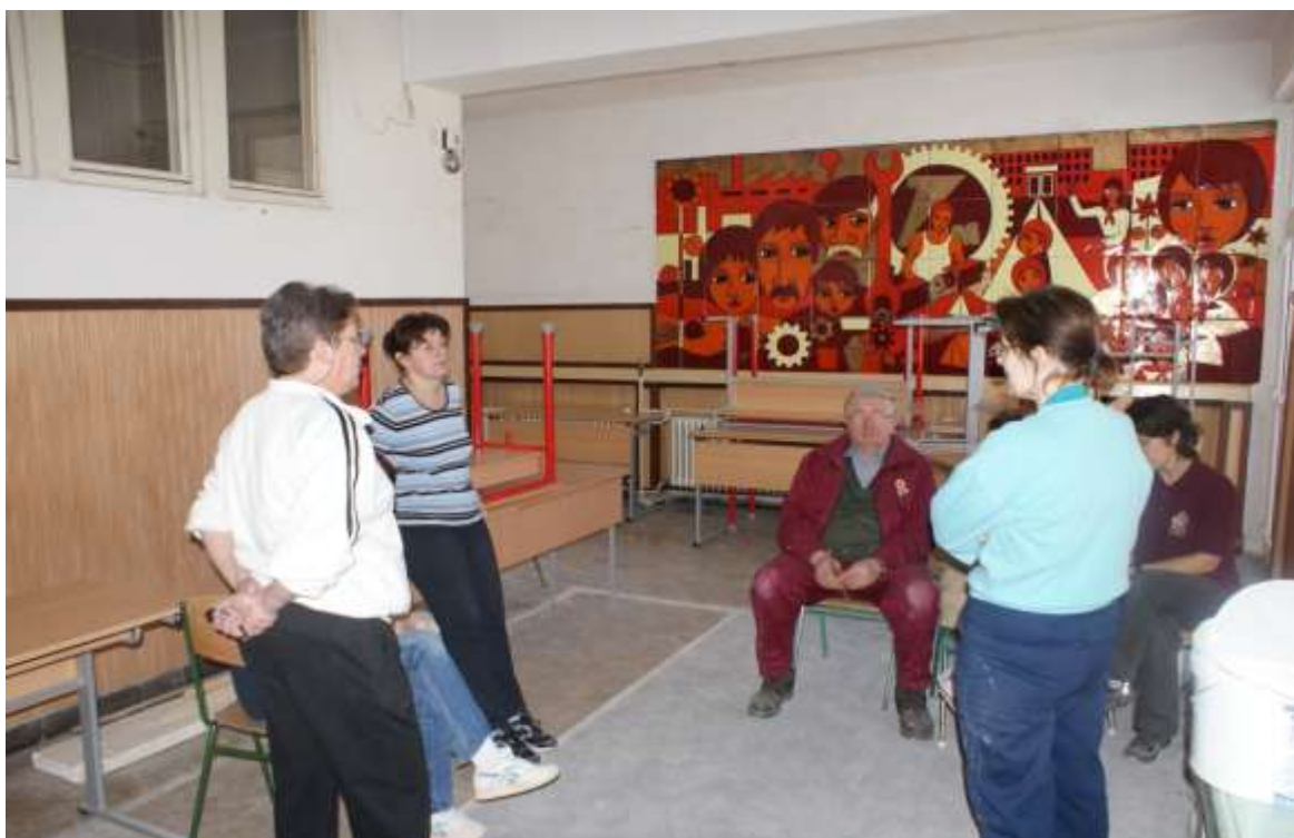
A sok munka eredménye