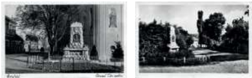
Korabeli képeslap és fotó az emlékműről. 2

Perczel Mór emlékművét 1933. november 12-én avatták fel a római katolikus templom előtti kert nyugati részén.