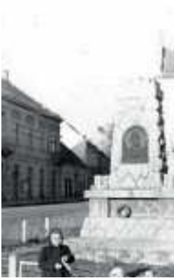
Fotó az emlékműről 1958-ból.