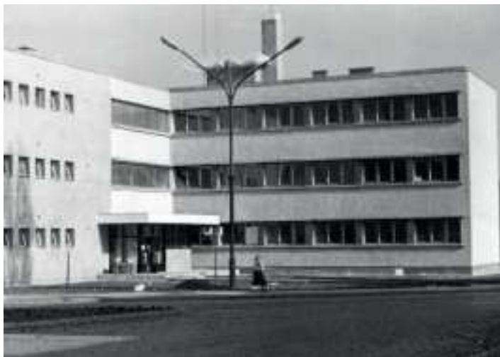
Az iskola új épülete (1967)

Ebben az időszakban az oktatás feltételi is jelentősen javultak. 1968. szeptember 30-án megindulhatott a tanítás a felépült új iskolában.