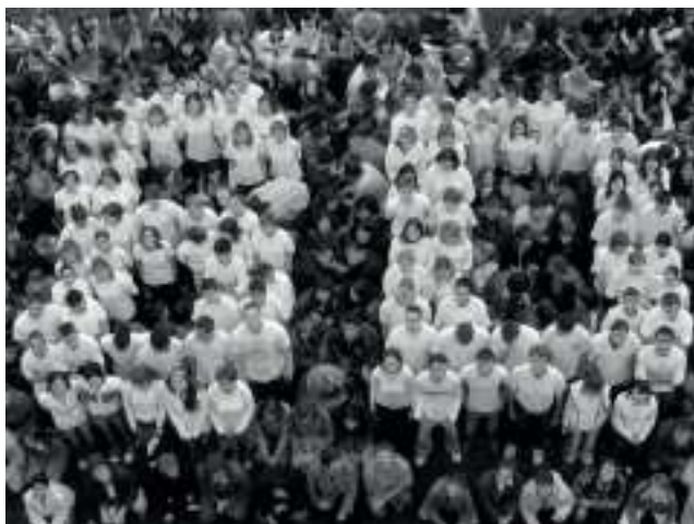
60 éves jubileum

Felnőttoktatás: A hagyományos levelező tagozatos képzésen az első végzős osztály 1962-ben fejezte be tanulmányait, majd az