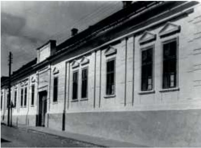
A régi „keri“, Bajcsy-Zsilinszky u. 38.