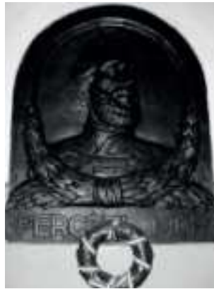
A dombormű ma