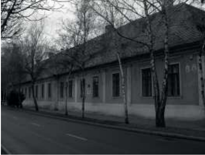
A kollégium alsó épülete, volt Perczel-kúria

Valamikor két épület állt a diákok rendelkezésére: a Perczel-