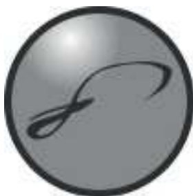
Iskolánk jelvénye feliratok nélkül