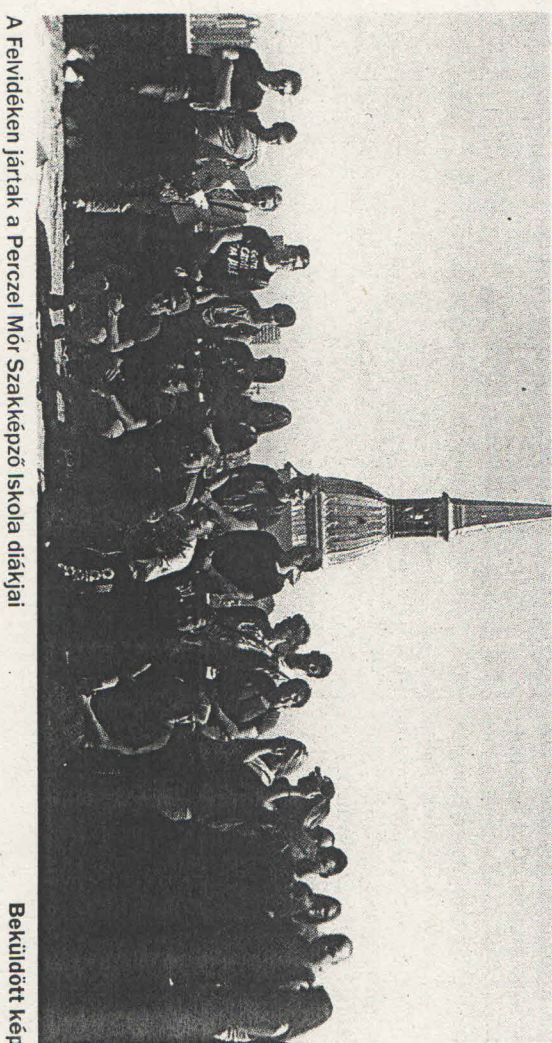
A Felvidéken jártak a Perczel Mór Szakképző Iskola diákjai

A Perczel iskola felvidéki partnerintézménye a Műszaki és Gépesítési Szakközép-