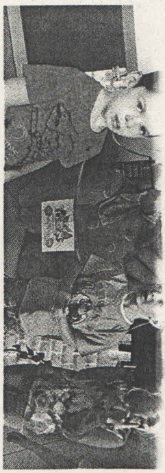
Vitathatatlanul Süsi volt a csoport kedvence

A legnagyobb népszerűségnek Süsi örvendett a csoport körében. Ez nem meglepő, ha azt vesszük alapul, hogy a fi-